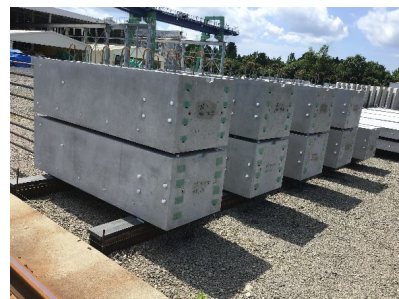
低炭素型プレキャストコンクリート 品質・コストは従来と同等以上で 低炭素性を実現