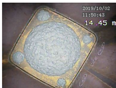
CFT柱の充填コンクリート 高強度・高流動な低炭素コンクリート