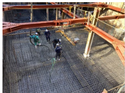
現場打ち低炭素コンクリート 基礎躯体への適用