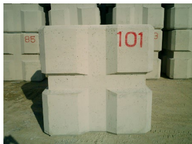
人工海底山脈用ブロック