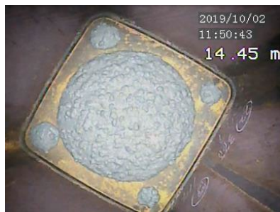
CFT柱の充填コンクリート 高強度・高流動な低炭素コンクリート