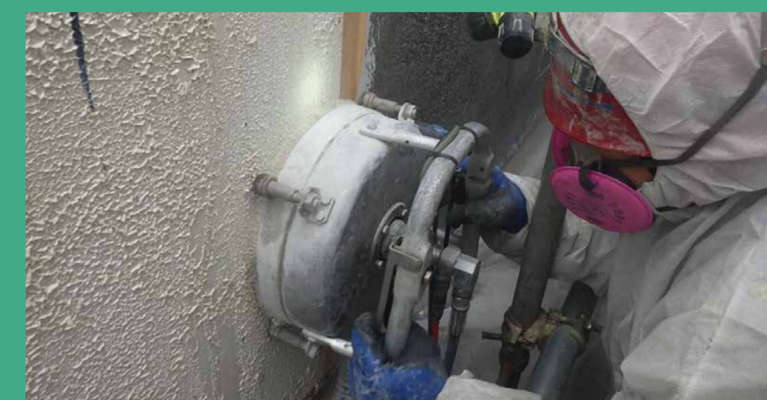
外壁塗膜材除去(アスベスト除去)