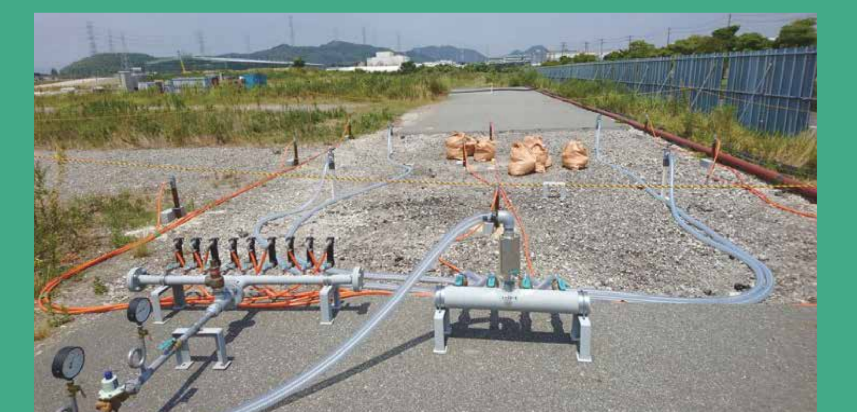
土壌汚染対策工事(原位置浄化)