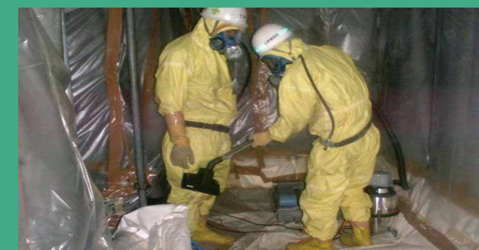
ダイオキシン類除染