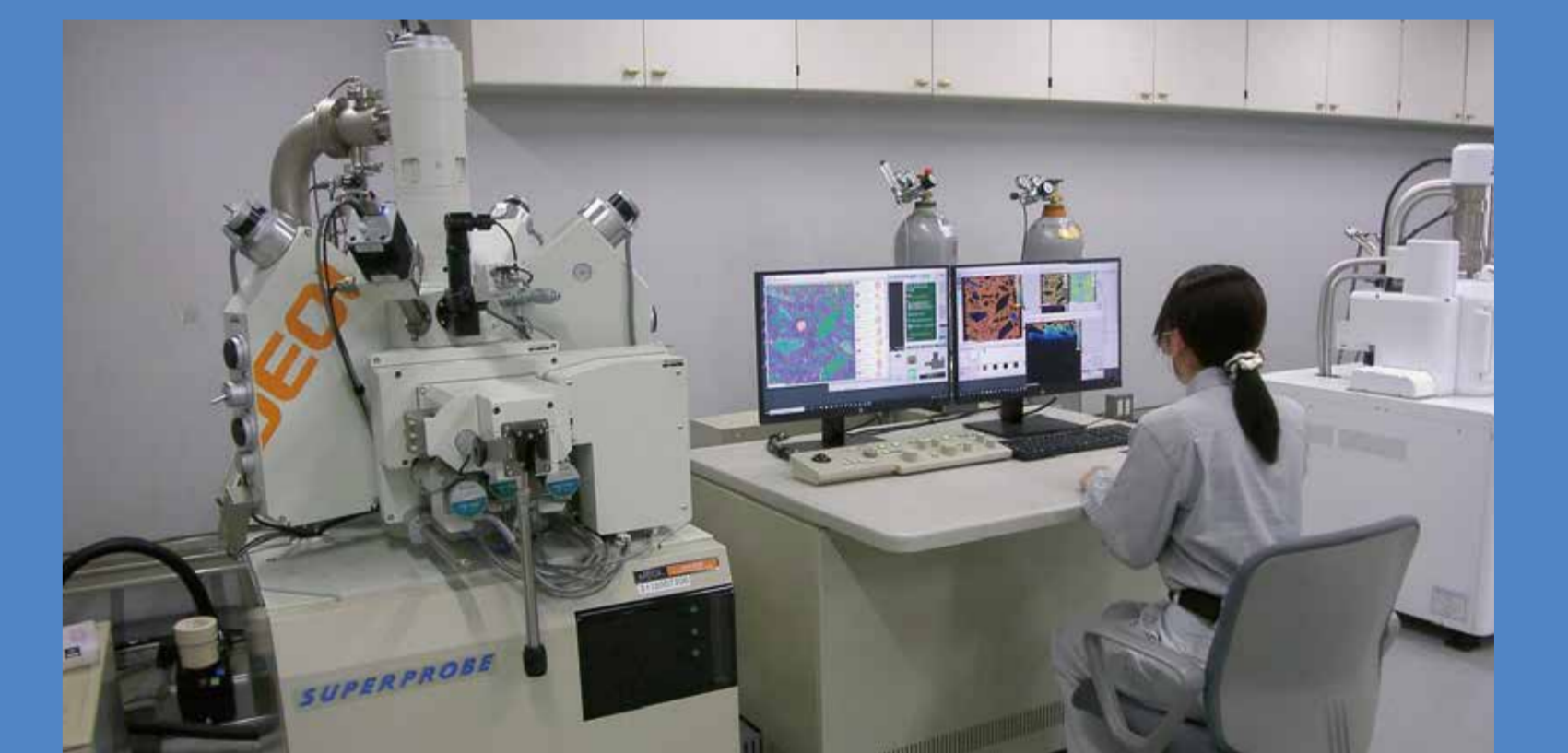
室内試験 土壌修復工法の提案