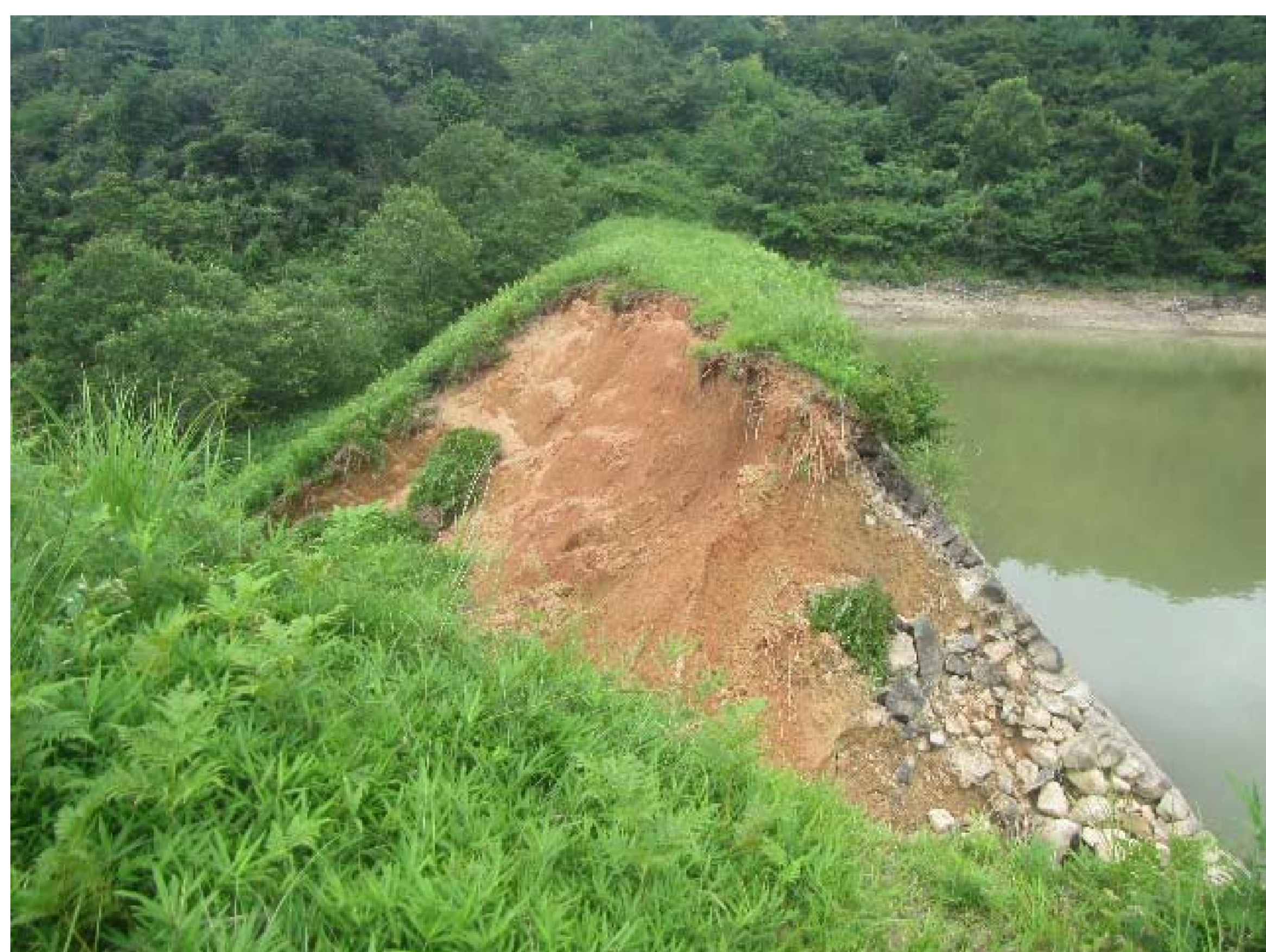
ため池豪雨被害（大田池、岡山県）

近年、豪雨や地震などの自然災害が頻発化・激甚化しており、平成30年7月豪雨や東北地方太平洋沖地震では複数のため池が被害を受けています。このような背景から、ため池などの堤体盛土を対象に豪雨と地震あるいは両者による複合災害に対する合理的な対策が求められています。