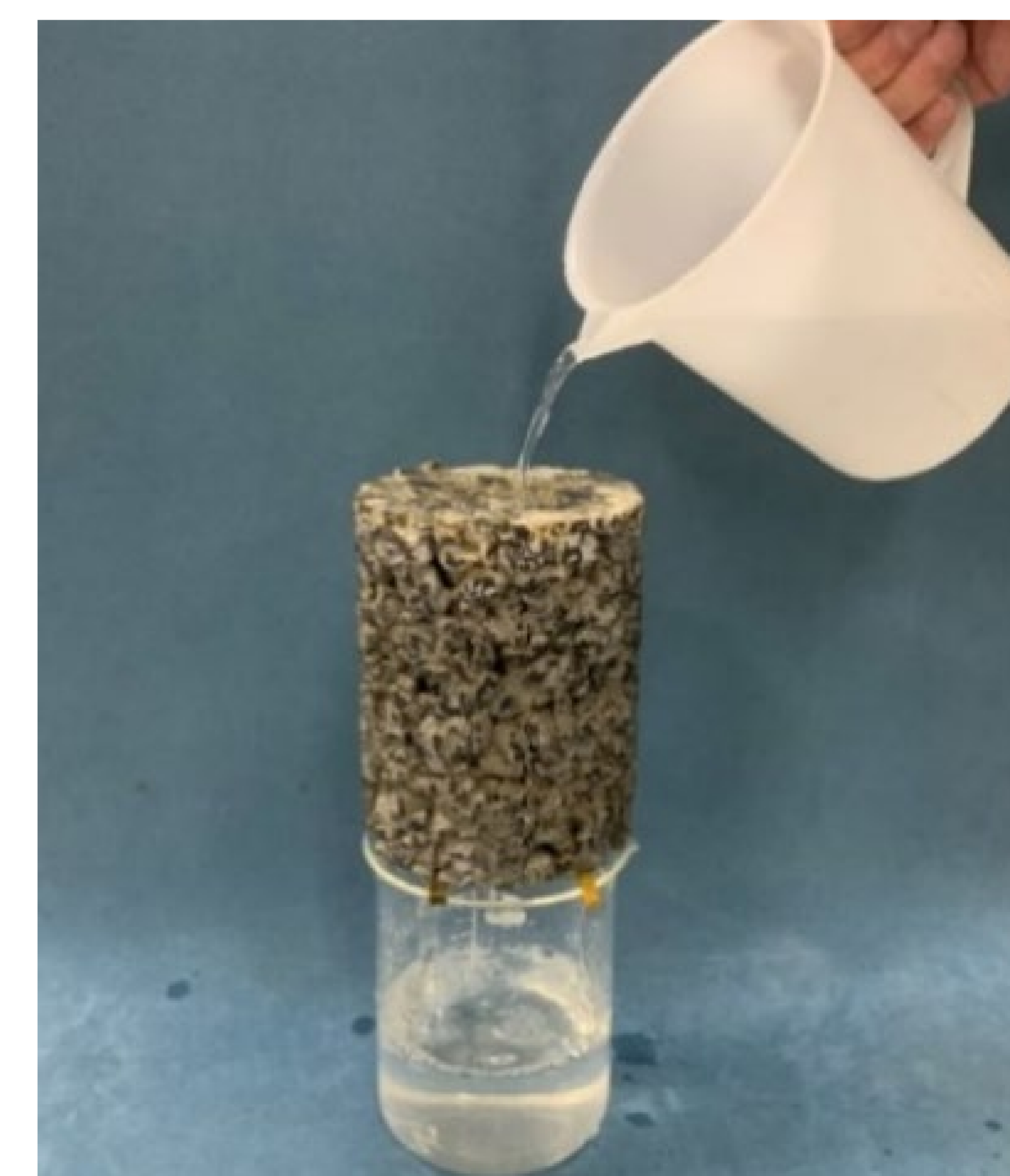
透水性改良体 透水係数 k=1.0 \times 10^{-3} \text{m/sec}