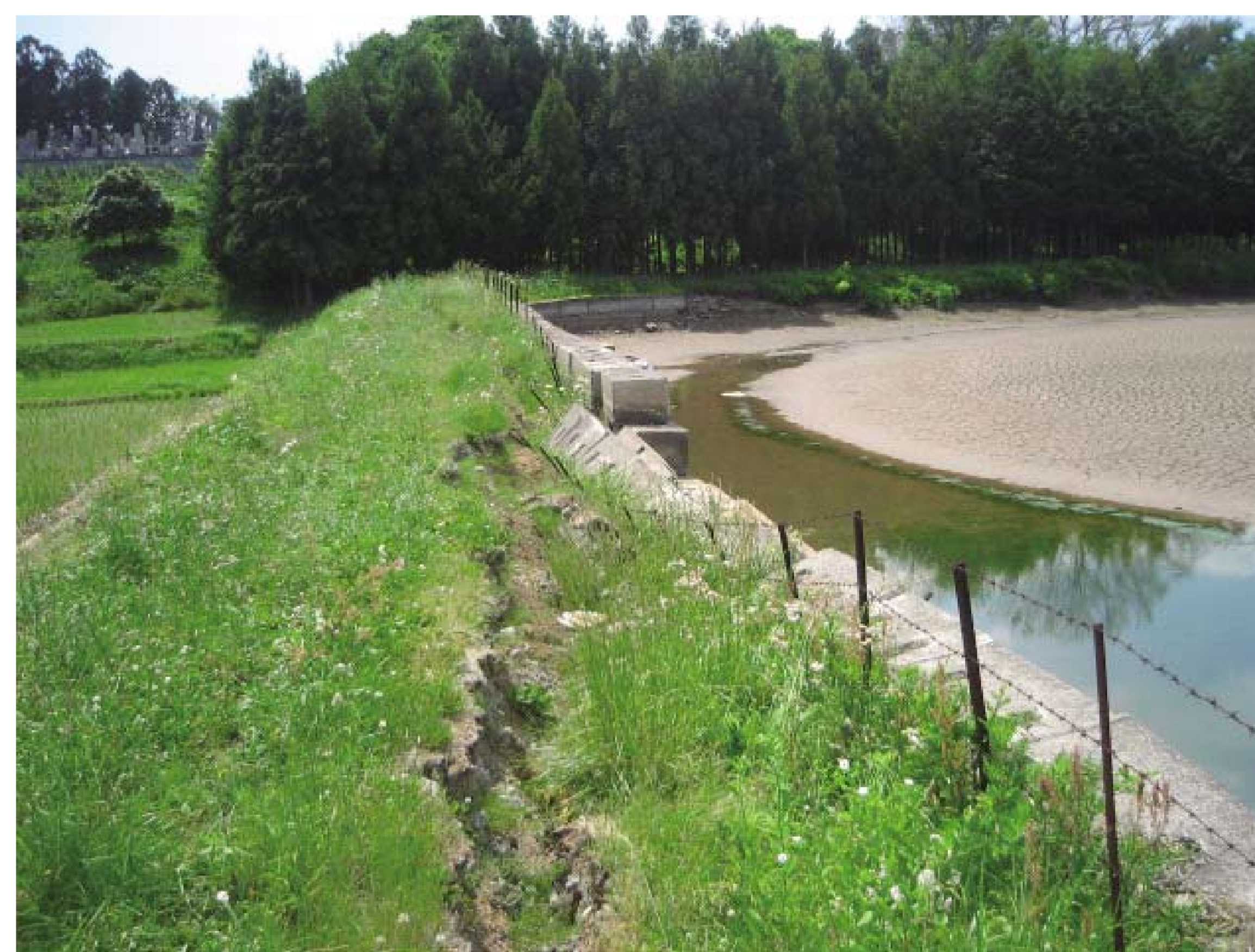
ため池地震被害（堂前池、福島県）